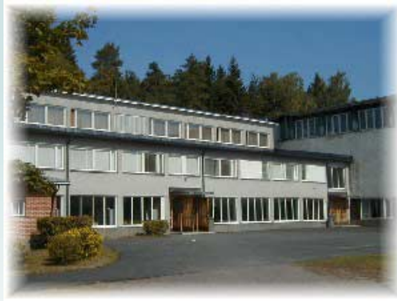
Karis svenska högstadium